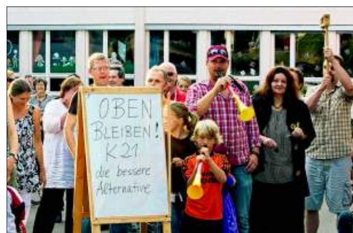
Auch in Stetten ist man gegen „S“ und für „K“.

So unterschiedlich wie ihr Alter und ihre Herkunft waren auch die Demo-Motive: „die äußerst mangelhafte