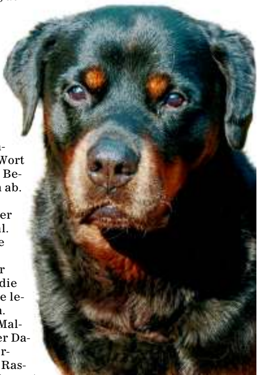
Rottweiler Paco: Stellvertretender Chef und unglaublich verschmust.

Seine „Pflichten“ sind ihm gerade schnuppe, der Rottweiler will einfach nur gekrault werden. Hund sollte man sein.